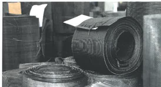
Široká škála výrobků z Kamenné míří do různých sektorů, mj. do elektrotechniky.

„Jsou to třeba vodní filtry, jehly nejvyšší kvality, součástky do zdravotnických respirátorů či nejrůznější vázací pásy. Našími tkaninami je vyzdobena střecha Tančícího domu v Praze. Naše roční výroba dosahuje objemu kolem 1,3 kilotuny. Váhově však